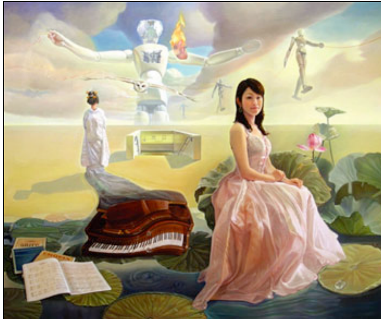
Tác phẩm "Lối ra".

Tác phẩm hiện trưng bày tại triển lãm Shutai 43 của Hội Mỹ thuật Chủ Thể, khai mạc ngày 1/9 tại Bảo tàng Mỹ thuật Trung ương Tokyo. Buổi khai mạc triển lãm có sự hiện diện của phu nhân đại sứ Việt Nam cùng các đại diện của Đại sứ quán và Thông tấn xã Việt Nam tại Tokyo.