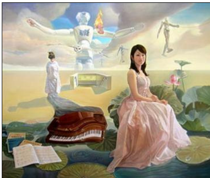
Bức tranh sơn dầu "Lối ra".